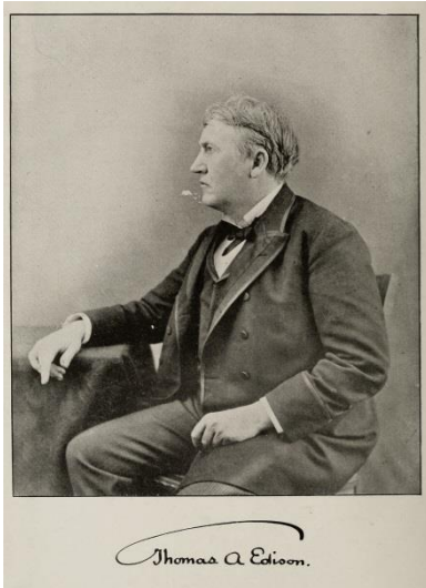
Американският изобретател Томас Едисон (1847

се съобщава било със сушата, било с друг параход в една окръжност от 50 километра. ... – Новини (Цариград), г. II, № 46, 3 март 1892, с. 3.