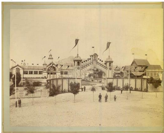
Парадният вход на

В деня на откриването на изложението ... – Новини (Цариград), № 95, 25 авг. 1892, с. 3. „... След това Князът обиколил изложението и се спрел при отделението на мореплавателн. дружество „Лloyd”. ...”