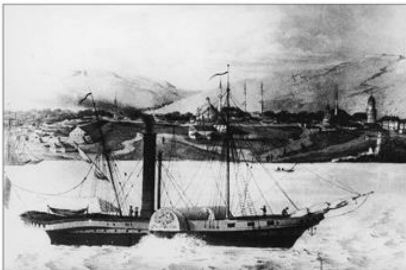
Der Dampfer „Argo“ war das zweite Schiff der DDSG. Es wurde 1833 in Wien-Erdberg erbaut und befuhr 1834 erstmals die nautisch schwierige Kataraktenstrecke zwischen Moldova und Turn Severin bis nach Sulina.

източник да се приема на доверие, защото той дори не е личен спомен, след като Д. Маринов е роден през 1846 г., т.е. 8 години след събитието . Това означава, че твърдението му е със съмнителен произход , т.к. няма никаква яснота кога, от кого и какво точно сведение е получил . А недостоверността на версията на Д. Маринов се доказва от източници от времето на събитията.