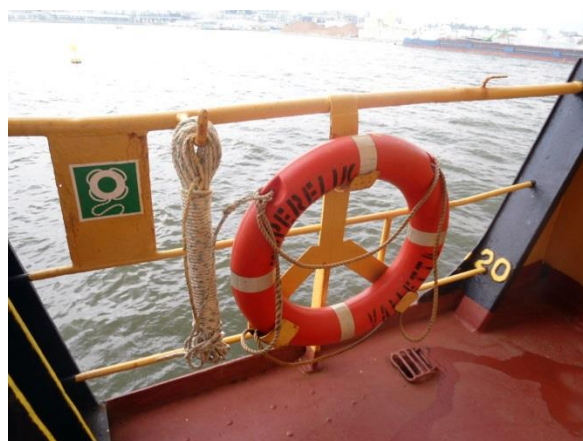
Работната лодка и кранът за нейното спускане, 2009 г.; Един от спасителните пояси, 2015 г.