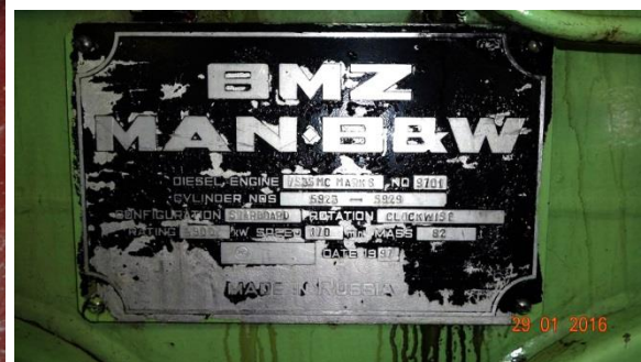
Поглед към един от хамбарите по време на натоварването му с метали, 2009 г.; Табелката на завода-производител (Брянск, Русия) на главния двигател на „Перелик“, 2016 г.