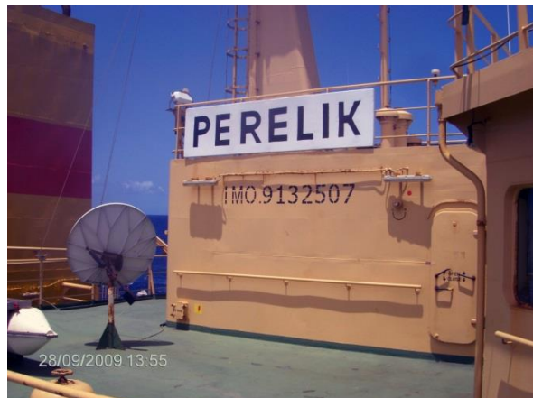
2014 г., „Перелик“ пристига в Калининград след сериозно обледеняване.; Поглед към основанието на главната мачта и надписа с името на кораба върху надстройката, 2009 г.