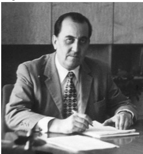
Инж. Георги Н. Георгиев-Кангасейро (1927–2011 г.) като генерален директор на Държавното стопанско обединение „Корабостроене“ (1970–1975 г.) -

През 2002 г. варненската Издателска къща „Морски свят“ издаде мемоарната книга „За българското корабостроене с любов“. Нейният автор инж. Георги Георгиев-Кангасейро (1927-2011 г.) е един от най-изтъкнатите и многозаслужили дейци на българското корабостроене, почетен гражданин на Варна (2007 г.). Имах честта да бъда редактор на тази книга [1], която следва да се изучава от всеки, който има желание да проучва и популяризира постиженията на българското корабостроене през периода 50-те–80-те години на ХХ в.