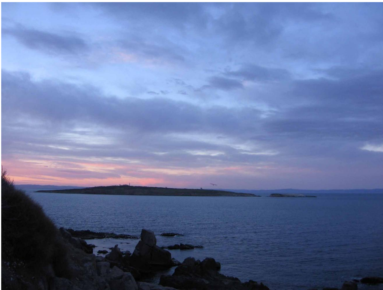
Островите Св. Иван и Св. Петър

Би трябвало да се наричат Св. Йоан и Св. Петър, както и преподобният ни чудотворец е Св. Йоан Рилски, а не Иван Рилски.