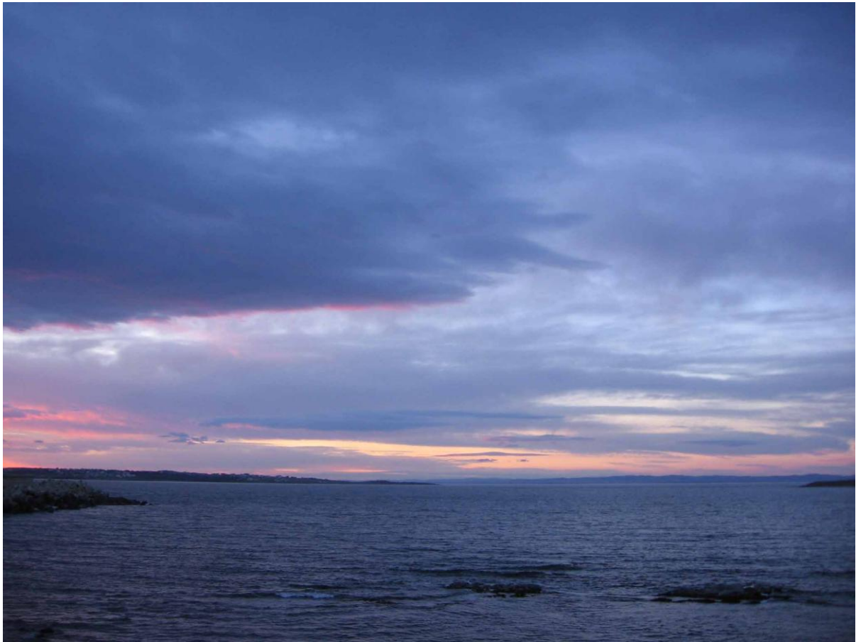
Бургаският залив, погледнат от Созопол