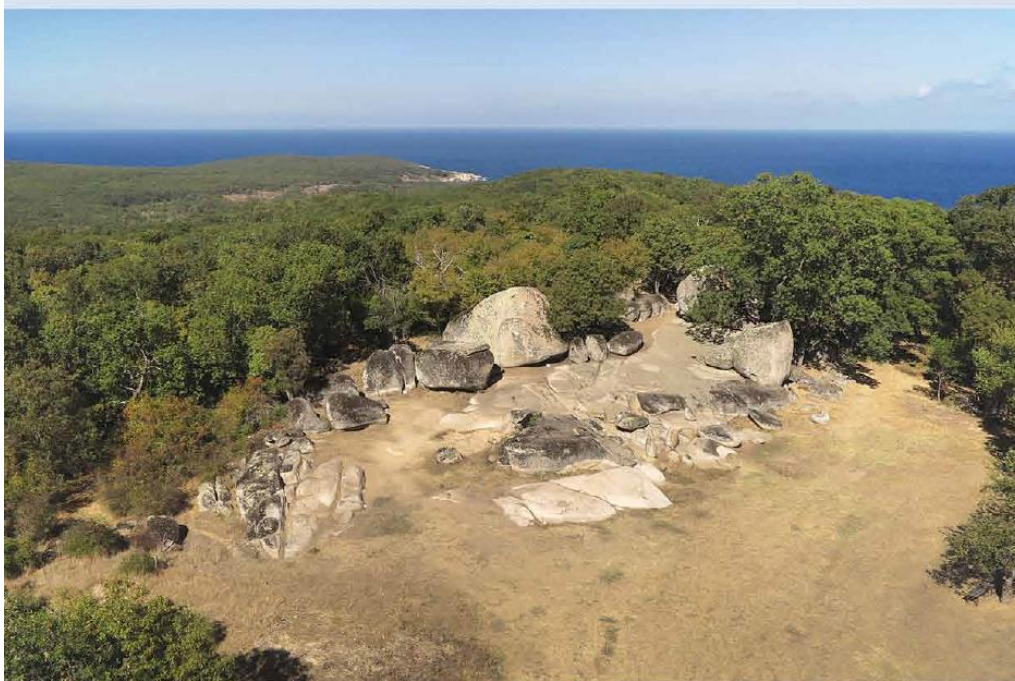
Тракийското светилище в м. Безлик таш, локация „Домбоданова 2003“, в. Пловдив, България

Скалното светилище в м. Безлик таш е едно от големите археологически открития в Приморска Странджа. Разположено е в най-високата част на полуостров, известен още от античността – Херсонесос. Светилището е с надморска височина 128 м и обща площ около 6 дка. Най-добре проучена е централната му част, където върху голяма скадна тераса, леко издигната над околния терен, са разположени в кръг с диаметър 56 м отделни скални елементи, които формират ритуално пространство.