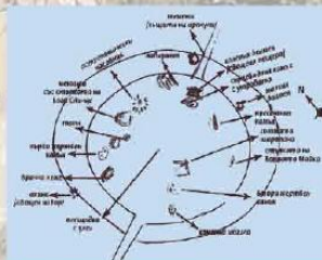
Реконструкция на тракийското ритуално пространство на светилището, 1200 - 800 пр. Хр.

Всъщност, целият полуостров (Херсонесос) е свещено пространство, в което се намират комплекс от тракийски могили, домени, малки скални светилища. Това богатство от древни паметници дава повод Приморската планина слезаща по десния бряг на р. Ропотамо да бъде наричана Свещена планина на траките металурзи. Споменът за нея е запазен в средновековни карти и портюлани.