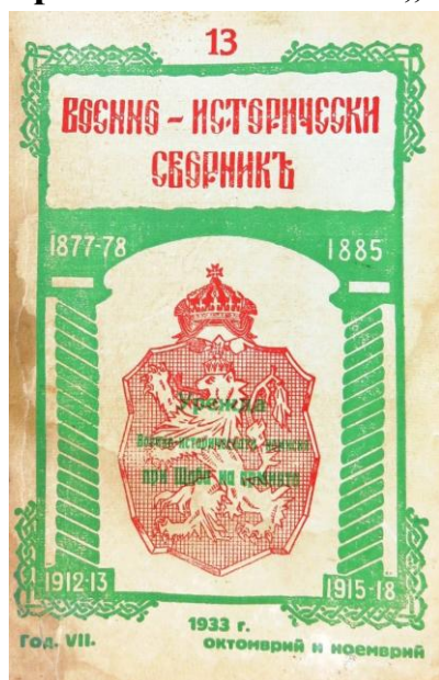
Корицата на Военноисторически сборник, кн. 13, 1933 г.