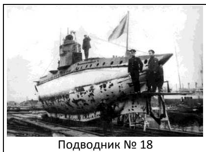
Подводник № 18

Тази година се навършиха 100 години от вдигането на българския военноморски флаг над първата българска подводница. Реших да си припомня всичко за Подводник № 18. И ми направи впечатление един привездан от много историци факт, който е много престижен.