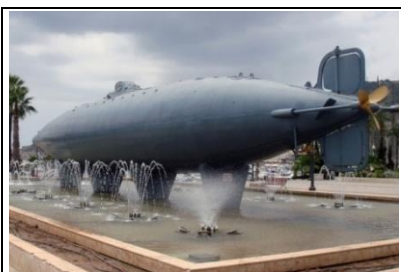
Испанската подводница „Перал“ в Морския музей в Картагена

Има още една страна, за която в „Jane’s Fighting Ships of World War I“ е посочено, че през войната притежава подводници – това е Испания, но първата си подводница получава през м. юли 1916 год. (стр. 285) – 2 месеца след България. В Испания е проектирана подводницата „Перал“ 21 още през 1884 год., построена е през 1888 год., но въпреки някои свои добри качества в сравнение с други проектирани и строени в тези години подводници, командването на испанския флот по време на изпитанията не я харесва като тип кораб и се отказва от продължаването на проекта през 1890 год., без тя да влезе в експлоатация 22 . Първата подводница „Перал“ е запазена и се намира в Морския музей в Картагена. В списъка на посочените тук страни са пропуснати 2 държави, притежавали подводен военен флот. Но те към 1916 год. са части от Британската империя и ги изпускам поради тази причина. Това са Австралия (от 1901 год. обединява 6 британски колонии под името Австралийски съюз с права на доминион на Великобритания) и Канада (от 1867 год. обединява 4 британски провинции под името Канадска конфедерация с права на федерален доминион на Великобритания). Те получават независимост с Уестминстърския статут от 1931 год. Страните, които през 1916 год. имат военни кораби но нямат подводници, са следните: Аржентина, Белгия, Венецуела, Еквадор, Китай, Колумбия, Коста Рика, Куба, Мексико, Никарагуа, Панама, Иран (тогава Персия), Румъния, Малайзия (тогава Саравак), Тайланд (тогава Сиам), Сърбия, Уругвай, Хаити и Хондурас.