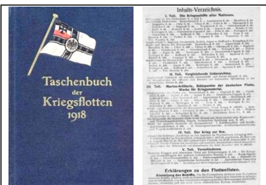
Справочника „Taschenbuch der Kriegsflotten – 1918“ и страницата с неговото съдържание

Има още една страна, за която в „Jane’s Fighting Ships of World War I“ е посочено, че през войната притежава подводници – това е Испания, но първата си подводница получава през м. юли 1916 год. (стр. 285) – 2 месеца след България. В Испания е проектирана подводницата „Перал“ 21 още през 1884 год., построена е през 1888 год., но въпреки някои свои добри качества в сравнение с други проектирани и строени в тези години подводници, командването на испанския флот по време на изпитанията не я харесва като тип кораб и се отказва от продължаването на проекта през 1890 год., без тя да влезе в експлоатация 22 . Първата подводница „Перал“ е запазена и се намира в Морския музей в Картагена. В списъка на посочените тук страни са пропуснати 2 държави, притежавали подводен военен флот. Но те към 1916 год. са части от Британската империя и ги изпускам поради тази причина. Това са Австралия (от 1901 год. обединява 6 британски колонии под името Австралийски съюз с права на доминион на Великобритания) и Канада (от 1867 год. обединява 4 британски провинции под името Канадска конфедерация с права на федерален доминион на Великобритания). Те получават независимост с Уестминстърския статут от 1931 год. Страните, които през 1916 год. имат военни кораби но нямат подводници, са следните: Аржентина, Белгия, Венецуела, Еквадор, Китай, Колумбия, Коста Рика, Куба, Мексико, Никарагуа, Панама, Иран (тогава Персия), Румъния, Малайзия (тогава Саравак), Тайланд (тогава Сиам), Сърбия, Уругвай, Хаити и Хондурас.