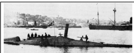
Турската подводница „Абдул Хамид“

време на Първата световна война. В интернет сайтовете на български и руски език не открих информация за турски подводници преди и през първата световна война.