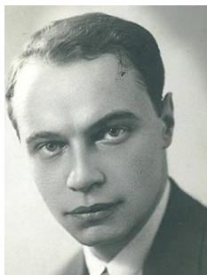
Арх. Димитър Ненов (1901–1953 г.) https://ubc-

bg.com/%D0%B4%D0%B8%D0%BC%D0%B8%D1%82%D1%8A%D1%80-%D0%BD%D0%B5%D0%BD%D0%BE%D0%B2/