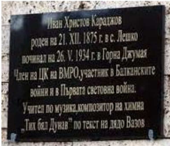
Паметната плоча на революционера Ив.

През 1968 [29, с. 270] и 2002 г. [30, с. 331-333] видният фолклорист акад. Н. Кауфман съобщава, че мелодията на „Тих бял Дунав” е заимствана от казашката приспивна песен „Спи, младенец мой” и е близка до руската народна песен „Вниз по матушке, по Волге”. И двете са достъпни в сайта ютуб, през 2004 г. за тях е напоменено в сайта на вестник „Сега” [31] и през 2008 г. – в сайта „Карта на времето” [32].