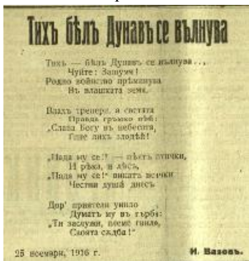
Вазов, Иван. Тих бял Дунав се вълнува. – Мир, №