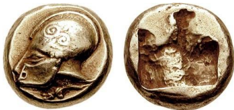
6. Статер на Фокея с шлема на основателя Фокос. Фиг. 6

Това обаче са ойкисти, които са предвождали групите на първите колонисти и те, естествено, са били гърци от определена метрополия и не са принадлежали към заварения на съответното място етнос. Позовавайки се на цитираните авторитетни нумизмати и отчитайки редица конкретни археологически и исторически факти за Месамбрия, аз приемам, че зад шлема на ранните месамбрийски оболи и драхми стои тракийският ойкист Мелсас. Но хиперкритично настроени учени биха ми възразили, че това остава спорно, защото авторите, които го споменават, са отдалечени по време от акта на възникването на политията Месамбрия.