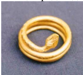
7. Златен пръстен от село Порой,

Месамбрия още преди идването на гърците (Фиг. 7).