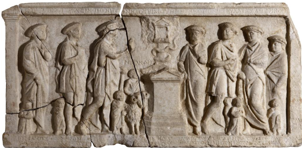
9. Релеф № 2 на месамбрийските стратези.

По-късни златни спираловидни (драконовидни и змиевидни) пръстени имаме от елинистическия некропол на Месамбрия (Фиг. 8; Гълъбов 1955, с. 142). Освен това тясната взаимовръзка „змия - Херос” (Херос-ойкистес) е засвидетелствувана в Релеф № 2, където в центъра на релефното поле е изобразена змия (Фиг. 9), която се вие около дърво над жертвеника и главата ѝ е устремена към едикула (хероон), разположена сред скали (Venedikov-Reliefs, p. 86, fig. 3); Fabricius, 1999, 80, Abb. 17).