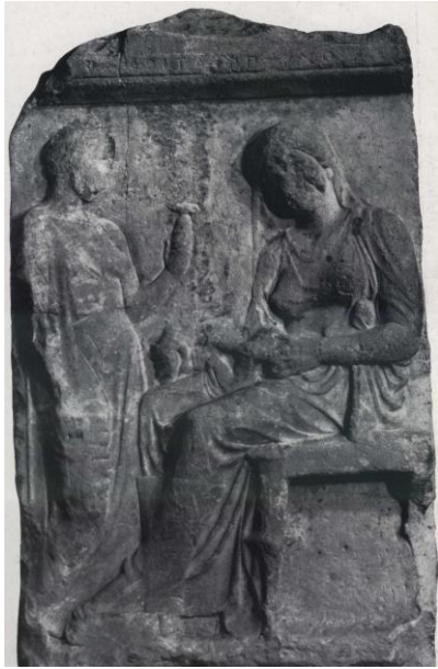
10. Надгробния релеф на Каликрита. Фиг. 10.

Въздействието на Атина върху Месамбрия и съседната Аполония е продължило през цялата първа половина на IV в. пр. Хр.