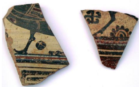
1. Родоско-йонийски фрагменти с изображение на сирени (началото на VI в. пр. Хр.).

Още през бронзовата епоха, през 2-то хилядолетие пр. Хр., днешният Несебърски полуостров е бил посещаван от кораби, доплавали от близки и далечни брегове. Доказателство за това са многобройните каменни котви, открити предимно в акваторията на днешното пристанище. Бронзовата и ранножелязната епоха са засвидетелствани и на самия полуостров. Тук са намерени керамични фрагменти, датиращи от този ранен период на тракийската история (Venedikov 1980, 7 – 22) .