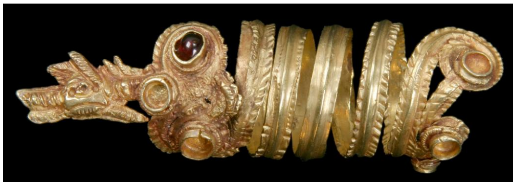
8. Златен пръстен от некропола на Месамбрия, моделиран като понтийското чудовище. Фиг. 8.