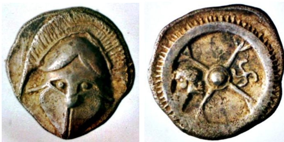
4. Драхмата с изображение на Мелса, аверс и реверс.